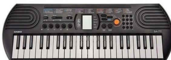
Teclado 44 teclas