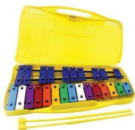
Metalófono 25 placas