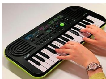
Teclado 32 teclas